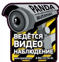
Стикер «Ведётся видеонаблюдение»