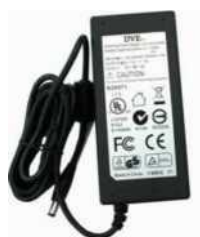
Блок питания регистратора