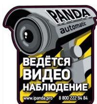
Стикер «Ведётся видеонаблюдение»