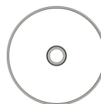
Диск с инструкциями и ПО