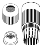
Водонепроницаемый комплект для RJ-45