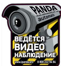
Стикер «Ведётся видеонаблюдение»