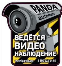
Стикер «Ведётся видеонаблюдение»