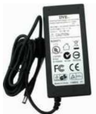
Блок питания регистратора