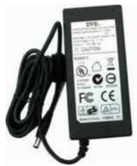
Блок питания регистратора